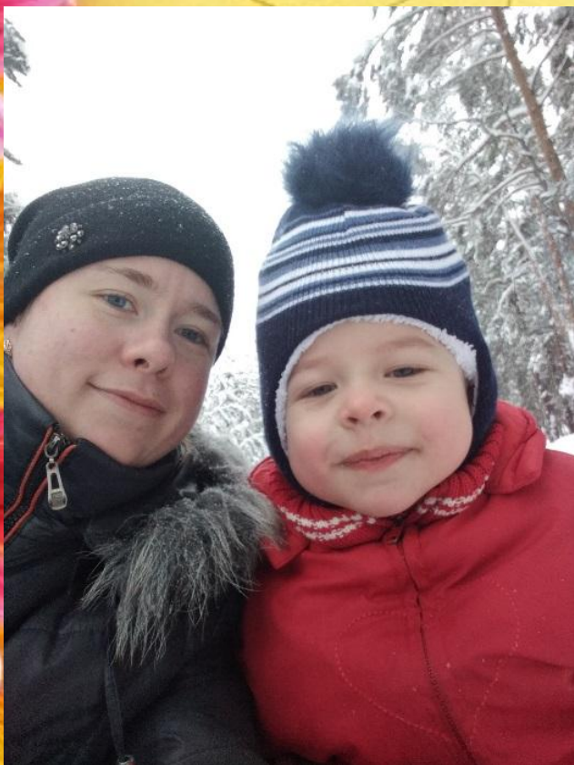
Прогулка по зимнему лесу