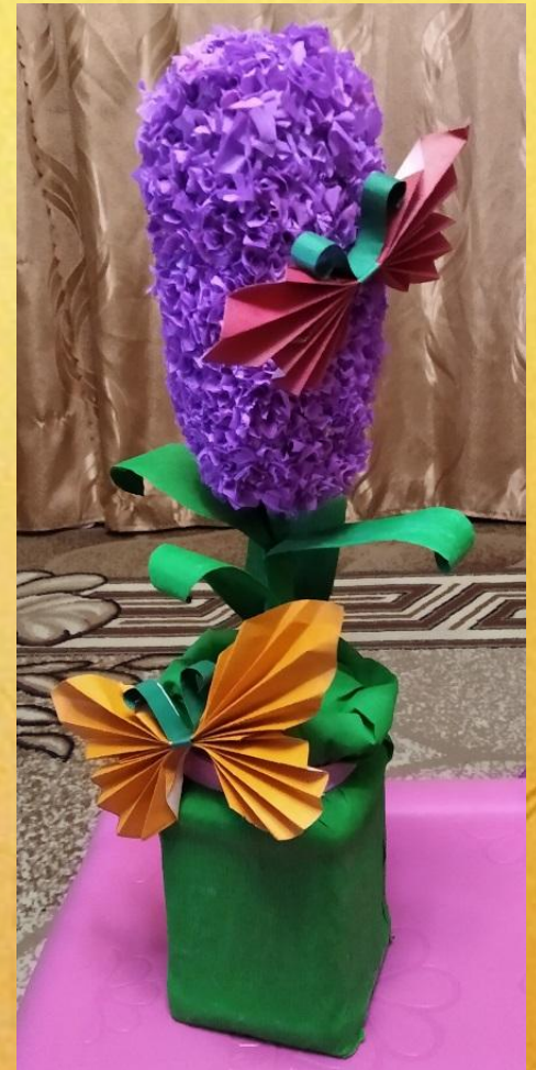
Гиацинт подарок на 8 Марта