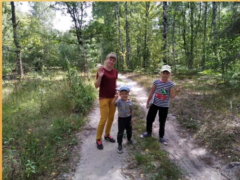
Прогулка по летнему лесу (собираем гербарий)