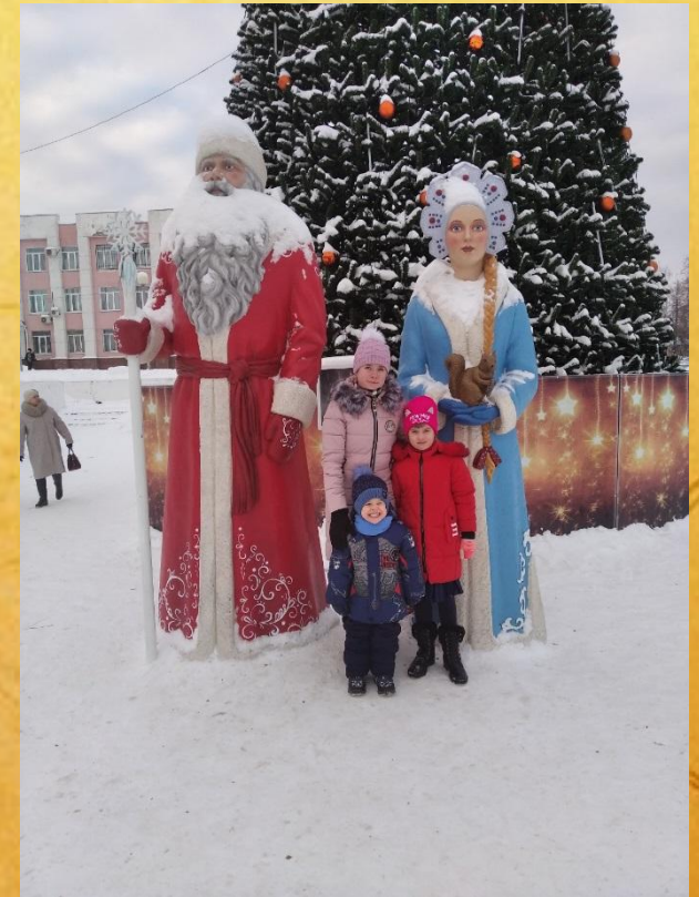
Новогодняя ёлка в Дворце культуры