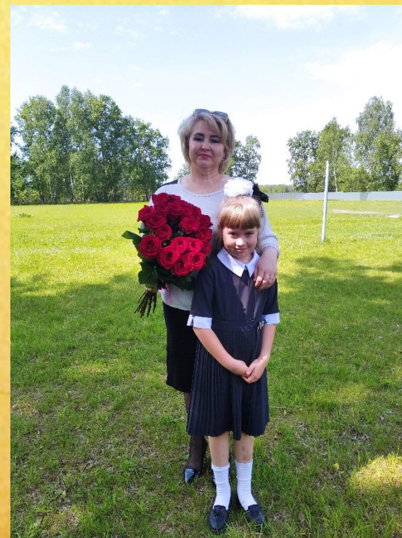
1 сентября «Первый раз, в 1 класс»