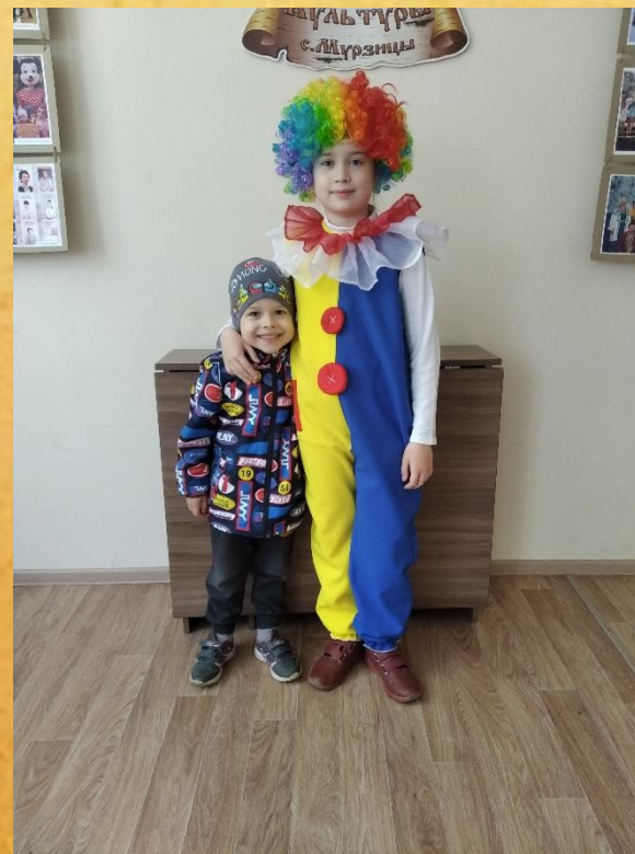
Танцевальный конкурс у дочки