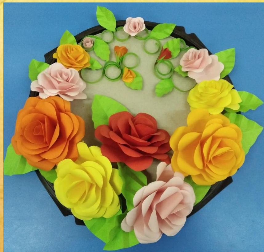
Розы в подарок на юбилей детскому саду