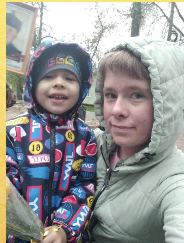
Парад 9 мая