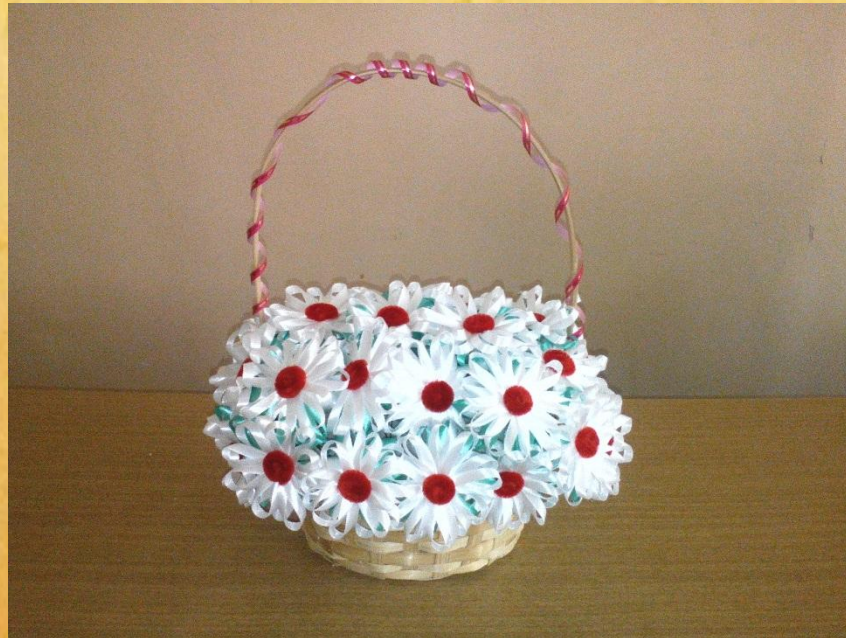
Ромашки к дню Семьи, любви и верности