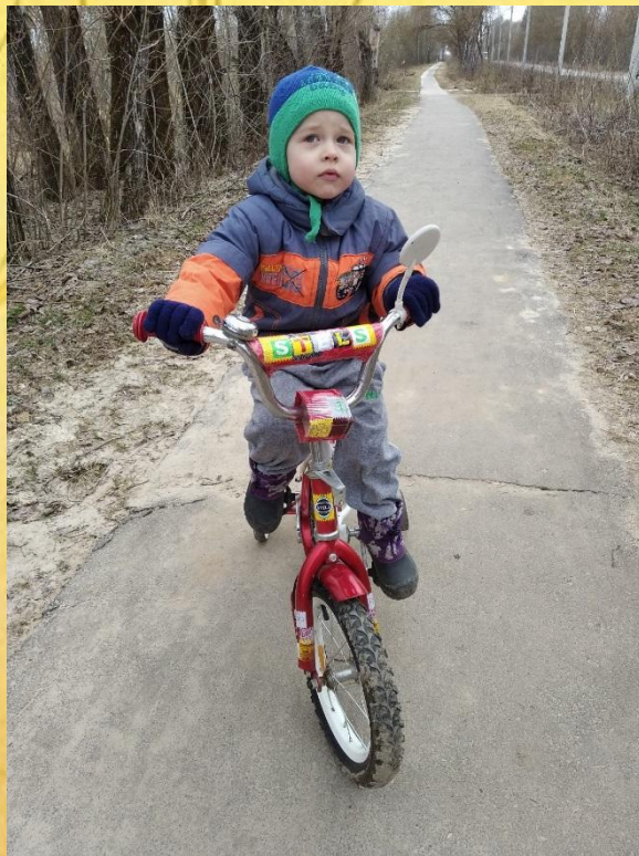
Учимся кататься на велосипеде