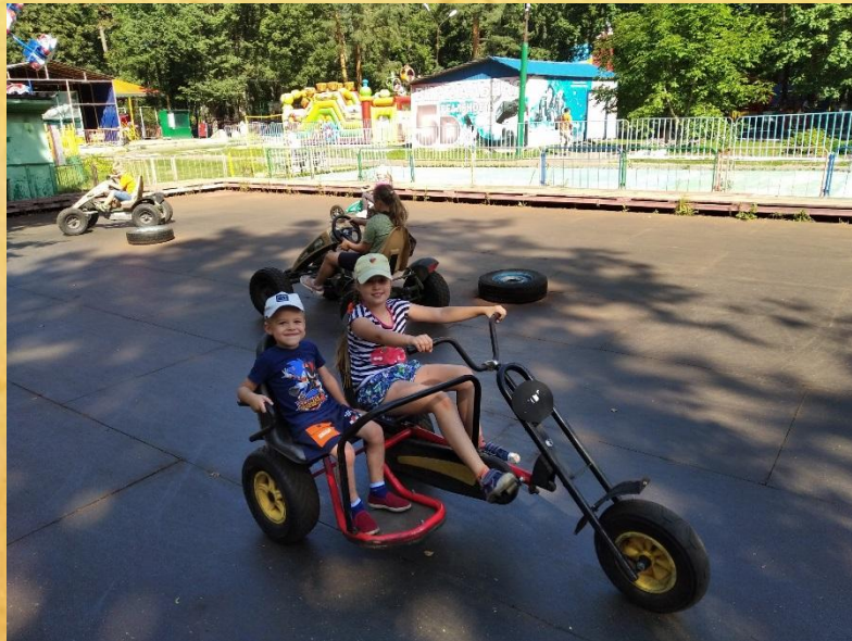
Поездка в г. Выкса Парк