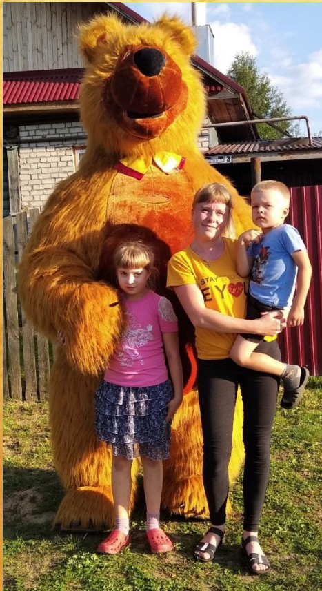
День рождение дочки

Не только на работе меня окружают дети, но еще и дома.